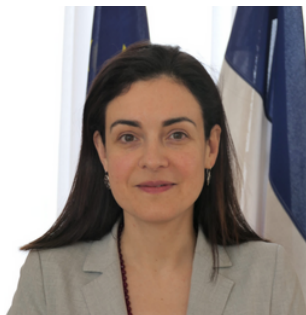
Cécile DINDAR, préfète de l'Aube